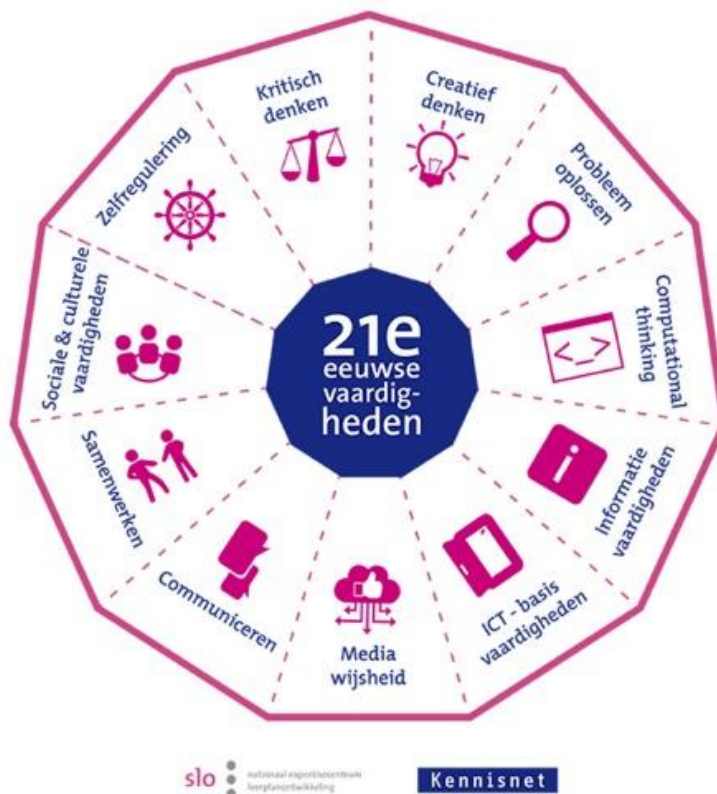
Figuur 1: Model 21st century skills

Het Rastholt richt zich op 'het ondernemende kind'. Het ondernemend leren fungeert als een kapstok, waar begrippen als eigenaarschap, een kritische leer-/werkhouding, samenwerken en feedback geven aan hangen. Het overkoepelende thema van al deze begrippen is 'de 21e-eeuwse vaardigheden'. Doel is om deze vaardigheden duidelijk te verbinden met de dagelijkse praktijk. Wij willen onze leerlingen ondersteunen bij de ontwikkeling van deze vaardigheden, vaardigheden die ze nodig hebben in de nieuwe kennissamenleving waarin ze terecht komen. In het onderstaande figuur worden de 21 e -eeuwse vaardigheden weergegeven. De vaardigheden zijn onderling met elkaar verbonden. Dat wil zeggen dat je voor bijvoorbeeld probleemoplossend denken ook kritisch en creatief moet zijn.